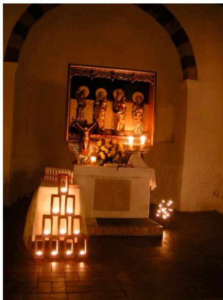
Osternacht in der Kirche Tschirma