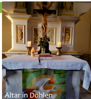
Altar in Döhlen