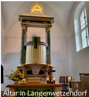
Altar in Langenwetzendorf