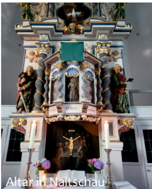
Altar in Naitschau

Platz der Freiheit 3, 07957 Langenwetzendorf Pfarrbüro Frau Stefanie Rost Telefon: 036625 / 20204 E-Mail: evangpfarramt.langenwetzendorf@t-online.de Sprechzeiten: Montag 15.30 bis 17.00 Uhr Donnerstag 09.30 bis 11.00 Uhr, 15.00 bis 17.00 Uhr