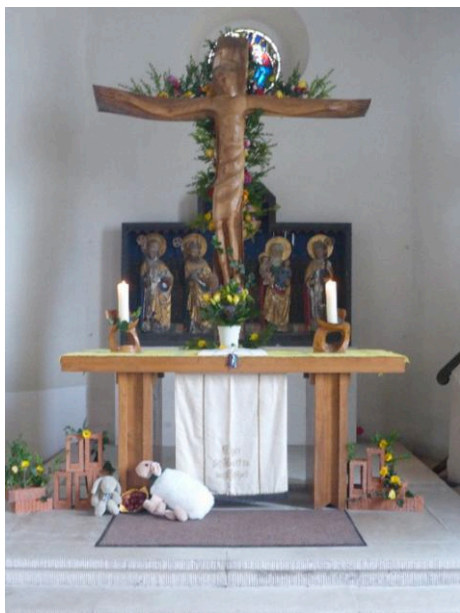
Blühendes Kreuz in der Kirche Nitschareuth