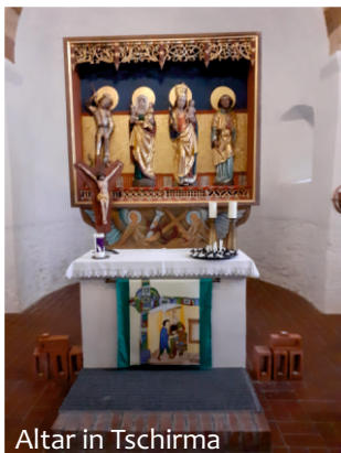
Altar in Tschirma