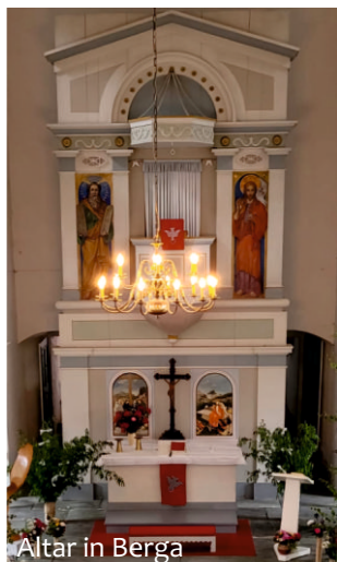
Altar in Berga