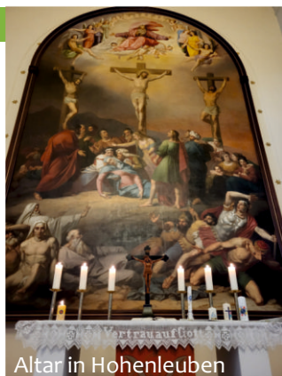
Altar in Hohenleuben