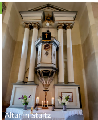
Altar in Staitz